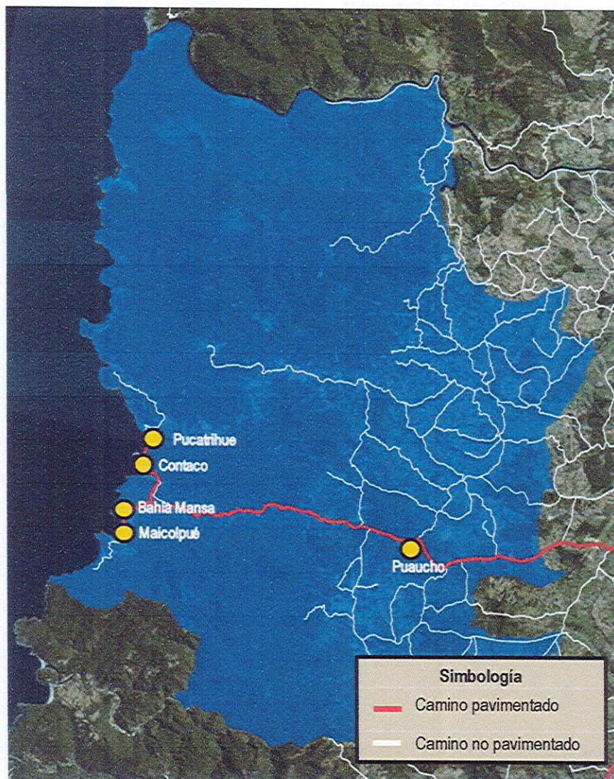
FIGURA N° 2-2: Ubicación de las localidades en estudio en la comuna de San Juan de la Costa