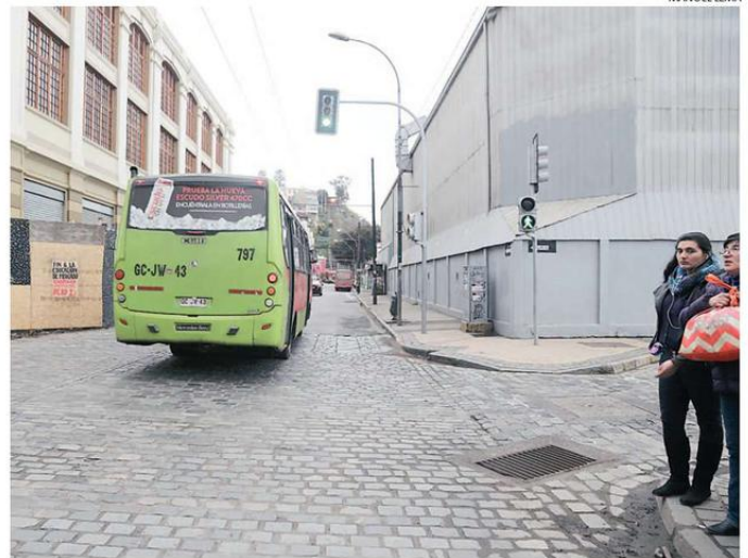
EN EL CRUCE DE CALLE SAN MARTÍN CON BLANCO SE PRODUJO EL MORTAL ACCIDENTE.

Ayer el Ejército de Salvación estaba buscando sus familiares a través de internet. En caso de no hallarlos buscarían los recursos para solventar los gastos del funeral, que en principio sería en el cementerio N°3 de Playa Ancha. “Lo sepultaremos dignamente, de forma cristiana como corresponde”, recaló el mayor José Fernández. ☺