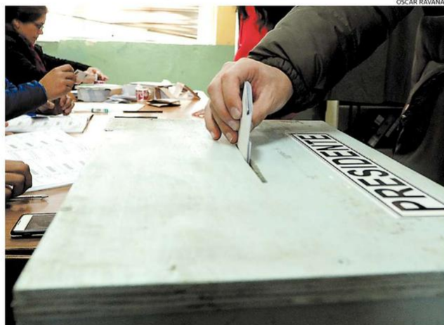
91.105 PERSONAS PARTICIPARON EN LAS PRIMARIAS 2017 EN LA ARAUCANÍA.

De acuerdo a las cifras del Servel, durante la jornada de ayer en la Región hubo una abstención de 88,8% en la elección que dejó al abanderado de Renovación Nacional, Sebastián Piñera, y Beatriz Sánchez (FM) como candidatos presidenciales oficiales de Chile Vamos y del Frente Amplio. Pese a que el porcentaje de participación fue bajo, éste no fue similar al registrado a nivel na-