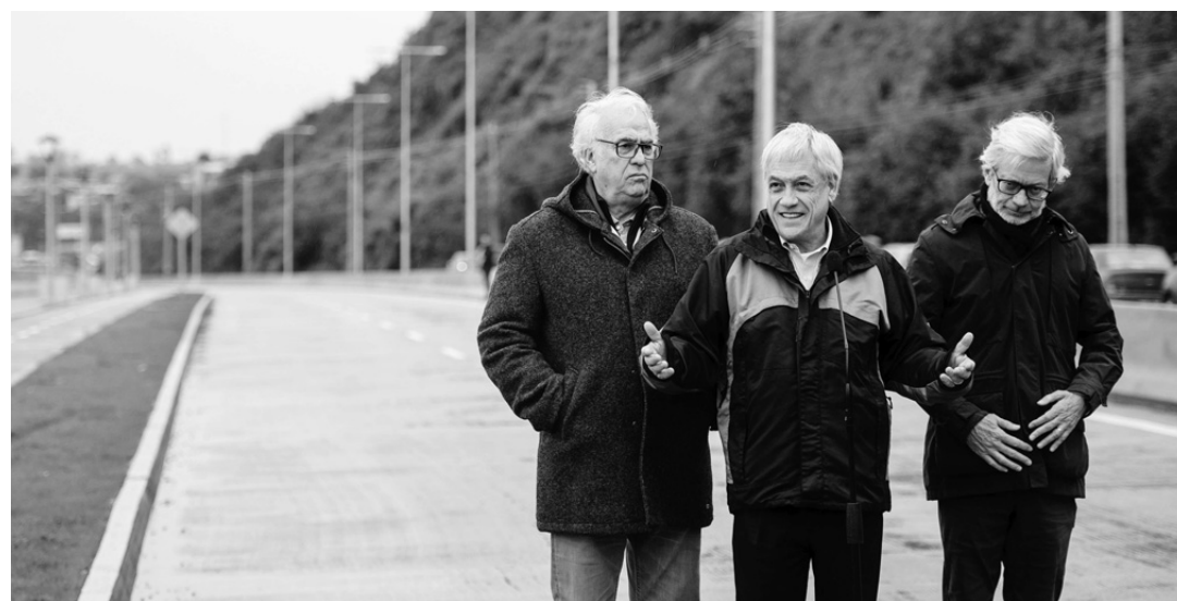
El Presidente Piñera se refirió al tema de visita en el sur.

En la ceremonia de corte de cinta de la ampliación de la Ruta 7, en el sector del Río Puelche-Pelluco (Puerto Montt), el Presidente afirmó: "Que este buen humor llegue al Congreso y nos aprueben todas las leyes". "Cuando lleguen los proyectos...", respondió, a su lado, el senador Rabindranath Quinteros (PS).