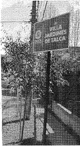
Los robos corresponden a una vivienda ubicada en la zona centro

rendido por y, luego, los brieron el lugar s especies