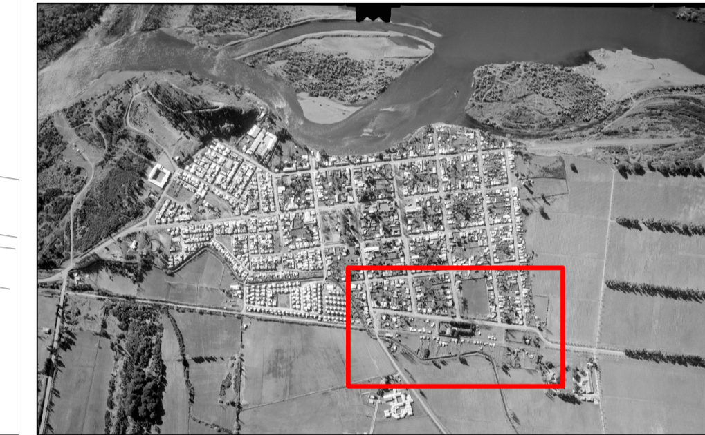
PLANO DE UBICACIÓN