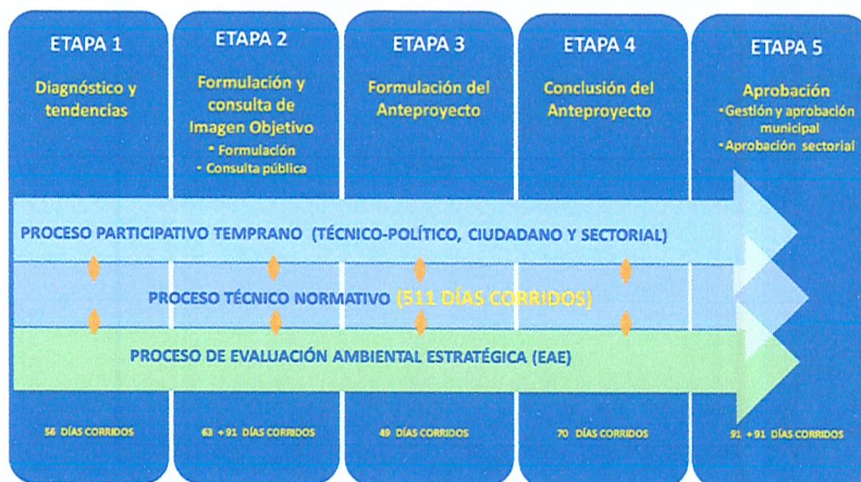
Figura 2: Esquema metodología general para el estudio actualizado

El plazo estimado para la elaboración y aprobación, vale decir, para diseñar y posteriormente sancionar el instrumento de planificación, es de 23 meses aproximados. Se distribuye en 5 etapas de trabajo, de acuerdo a la descripción en la siguiente figura: