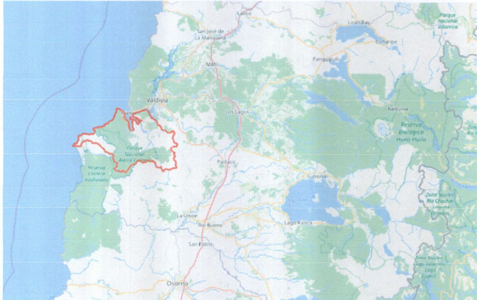
Figura 1. Localización de la comuna en el contexto regional