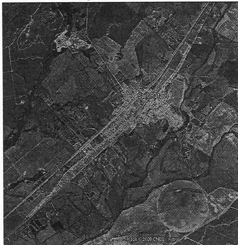
San Rafael imagen satelital 2003 (amarillo) – 2020 (rojo)