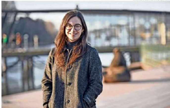
LA SUBSECRETARIA ESTUVO EL MIÉRCOLES Y JUEVES EN ACTIVIDADES EN MAFIL Y VALDIVIA.

das por la subsecretaria, hay cerca de 800 empresas que han solicitado el "Sello 40 horas". En Los Ríos son 9 las que ya lo tienen (ver recuadro), lo que desde la subsecretaría de Economía y Empresas de Menor Tamaño es visto de buena manera.