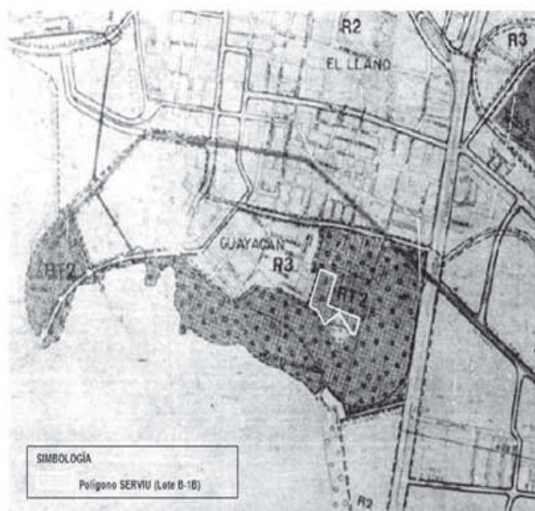
Fig. Plano Regulador Comunal de Coquimbo (D. O. 1984).

Toda la documentación estará disponible desde el 15.01.2018 al 26.02.2018, ambas fechas inclusive de lunes a viernes, de 8:30 a 13:30 horas, en la Secretaría Regional Ministerial de Vivienda y Urbanismo de la Región de Coquimbo, ubicada en Calle Almagro N° 372, tercer piso, La Serena; período en el cual se podrán aportar antecedentes cuya consideración estime relevante para la adecuada elaboración de la Modificación y formular observaciones al proceso de Evaluación Ambiental Estratégica desarrollado hasta este momento, de forma escrita y en formato físico (oficina Secretaría Regional) o electrónico a través de correo electrónico eae_ipt_reg4@minvu.cl