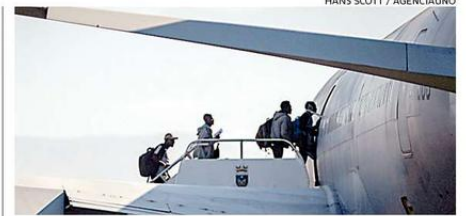
CIUDADANOS HAITIANOS EN EL GRUPO 10 DE LA FACH.

El Metro de Santiago recibió las felicitaciones desde la compañía de Transportes Metropolitanos de Barcelona, el Metro de Madrid y la Compañía de Transportes de París por Twitter.