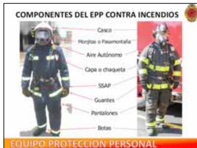
Este es el EPP (equipo de protección personal) de Bomberos.

adquiridos masivamente, tienen sobre los diez años. Por eso el consejo regional de bomberos presentó hace algunos años un proyecto para la renovación de estos equipos por un monto de 1.600 millones de pesos, de los cuales bomberos cancela 600 millones; «o sea estamos pidiendo al Consejo Regional mil millones. Esto ha dormido el sueño de los justos, hay que decirlo derechamente. Con la Intendencia del señor Gabriel Aldoney no tuvimos respuesta y con la actual autoridad estamos pidiendo una respuesta si es factible poder financiar esto. Lo que nosotros estamos hoy en día convocando es el riesgo que significa, y es hacer ver que a nosotros los bomberos nos gustaría que con la misma rapidez que se entregan 2.800 millones a Conaf, con esa misma rapidez nos gustaría que a nosotros los