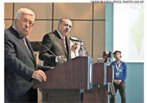
MAHMUD ABÁS, PRESIDENTE DE PALESTINO (IZQ.), JUNTO A RECEP TAYIIPP ERDOGAN, SU HOMÓLOGO TURCO.

La propia OCI, que agrupa a 57 Estados de mayoría musulmana, reconoce desde su fundación en 1969 a Palestina como miembro pleno, con capital en Jerusalén.