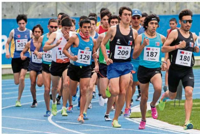
DEPORTISTAS DE TODAS LAS REGIONES DEL PAÍS PARTICIPARÁN EN LOS JUEGOS NACIONALES.

A la espera de que eso ocurra, el edil y su equipo están gestionando los cerca de 4.000