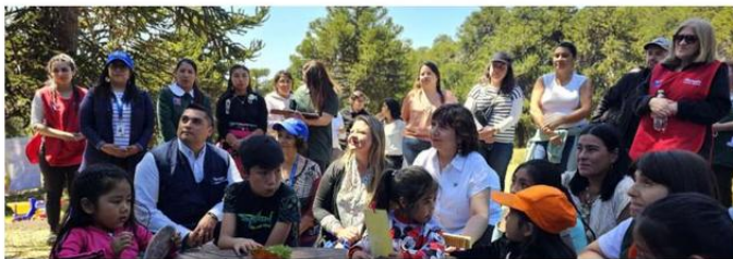
LA METODOLOGÍA DEL PROGRAMA DEFINE UNA PARTICIPACIÓN ACTIVA DE LAS FAMILIAS, LA COMUNIDAD, LOS NIÑOS Y LAS NIÑAS.

En este contexto, en el año 1994 se crea el programa no convencional “Veranadas Pehuenche”, liderado por el Departamento Educativo de Integra Araucanía y los equipos de los jardines infantiles rurales de la Fundación (Mallín