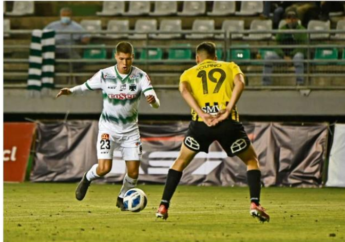
DESDE LA TEMPORADA 2022 QUE NO SE ENFRENTAN DEPORTES TEMUCO Y ARTURO FERNÁNDEZ VIAL.

En la jornada, el club también ratificó el arribo de su