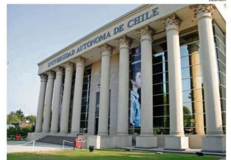
DESDE EL 17 AL 20 DE ENERO SE REALIZARÁ LA PRIMERA FASE DE MATRÍCULA.

Se apoyará de manera presencial a los nuevos estudiantes en este proceso en el Coliseo, ubicado en calle Porvenir #649, desde las 8 hasta las 20 horas los días 17 y 18 de enero; desde las 8 a 18 horas el día 19 de enero y, el sábado 20, de 9 hasta las 14 horas. ☞