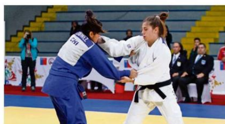
EL EVENTO SE DISPUTARÍA EN SEPTIEMBRE DE ESTE AÑO.

“Desde ya estamos dispuestos a colaborar en todo. Sería un tremendo aconteci-