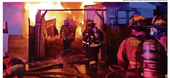
BOMBEROS DE LA SÉPTIMA, TERCERA Y SEGUNDA COMPAÑÍA TRABAJARON EN EL LUGAR.