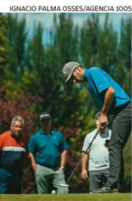
EL TORNEO REUNIÓ A JUGADORES DE TRES PAÍSES.

segunda región fuera de la Metropolitana en albergar la cita. La primera fue la del Biobío en 2017.