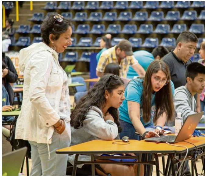
HASTA EL 19 DE ENERO LAS UNIVERSIDADES TENDRÁN ESPACIOS HABILITADOS PARA AYUDAR A LOS ESTUDIANTES EN EL PROCESO DE MATRÍCULA.

Para este proceso, la casa de estudios también contará con matrículas habilitadas pa-