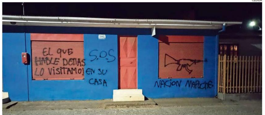
ESTA ES UNA DE LAS CASAS QUE APARECIERON RAYADAS EN HORAS DE LA MADRUGADA DEL LUNES.

“Quisimos ir para darle la tranquilidad a los vecinos de Pidima en el sentido que vamos a estar ahí, que vamos a acompañarlos y no los vamos a dejar solos. Cuando hay perso-