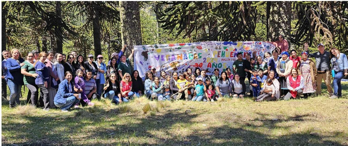
SE TRATA DE UN PROGRAMA EDUCATIVO NO CONVENCIONAL ÚNICO EN EL PAÍS, QUE SE DESARROLLA DESDE EL AÑO 1994.