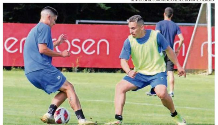
EN LAS INSTALACIONES DEL COMPLEJO M-II DE LABRANZA SE DESARROLLA LA PRETEMPORADA ALBIVERDE.

La pretemporada albiverde partió el pasado 10 de enero y se complementará con partidos amistosos.