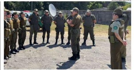
EN LA OPORTUNIDAD SE DESTACÓ QUE ESTE TIPO DE OPERATIVOS SE REALIZARÁ DURANTE TODO EL VERANO.