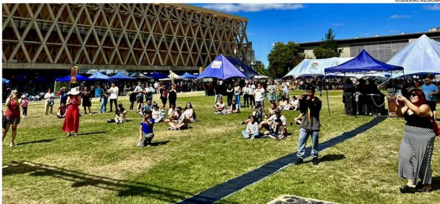
EL FESTIVAL CULTURAL DE LA CERVEZA CONVOCÓ A CERCA DE 3 MIL DE PERSONAS QUIENES DISFRUTARON DE LO MEJOR DE LA CERVEZA ARTESANAL DE LA COSTA, ADEMÁS DE UNA VARIADA PARRILLA DE ACTIVIDADES Y MÚSICA EN VIVO.

La actividad gratuita contempló la participación de variadas cervecerías artesanales, que ofrecieron al público regional, cerca de 40 variedades de cerveza, entre ellas, estuvieron presentes: Cervezas Monte Leona de Perquenco, Cervezas Zauber de Carahue, Cervezas Nuevo Imperio de Nueva Imperial, Cervecería Chucauco de Carahue, Cervezas Maquehue de Padre Las Casas, Santa Cerveza de Carahue, además de Cerveza la Crespa y Cerveza Artesanal Wild, ambas provenientes de la comuna de Temuco, quienes es-