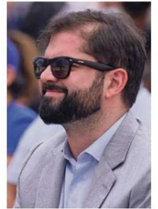
EL PRESIDENTE PARTICIPÓ AYER DEL GABINETE PRO CRECIMIENTO Y EMPLEO, JUNTO A EMPRESARIOS EN LA REGIÓN DE COQUIMBO.

“No tengo ninguna duda respecto de la probidad de los ministros, pero eso no tiene por qué compartirlo en la opinión pública y por lo tanto, lo importante es que esto sea lo más transparente posible”, afirmó Boric y agregó: “Yo no tengo ninguna duda que mis ministros actuaron de buena fe, pero gracias al debate público que se ha dado, se ha podido establecer que, en algunos casos en específico, se haya podido hacer de mejor manera y eso es lo que se ha corregido”.