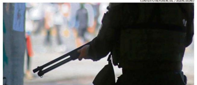
LOS HECHOS OCURRIERON EL 19 DE OCTUBRE EN LOS ALREDEDORES DEL SECTOR CARRUSEL, EN TEMUCO.

Un proyectil balístico que provino de la escopeta del oficial de Carabineros fue el que impactó el ojo derecho de un joven que estaba en el lugar, quien resultó con un traumatismo ocular grave. Tras 15 días de