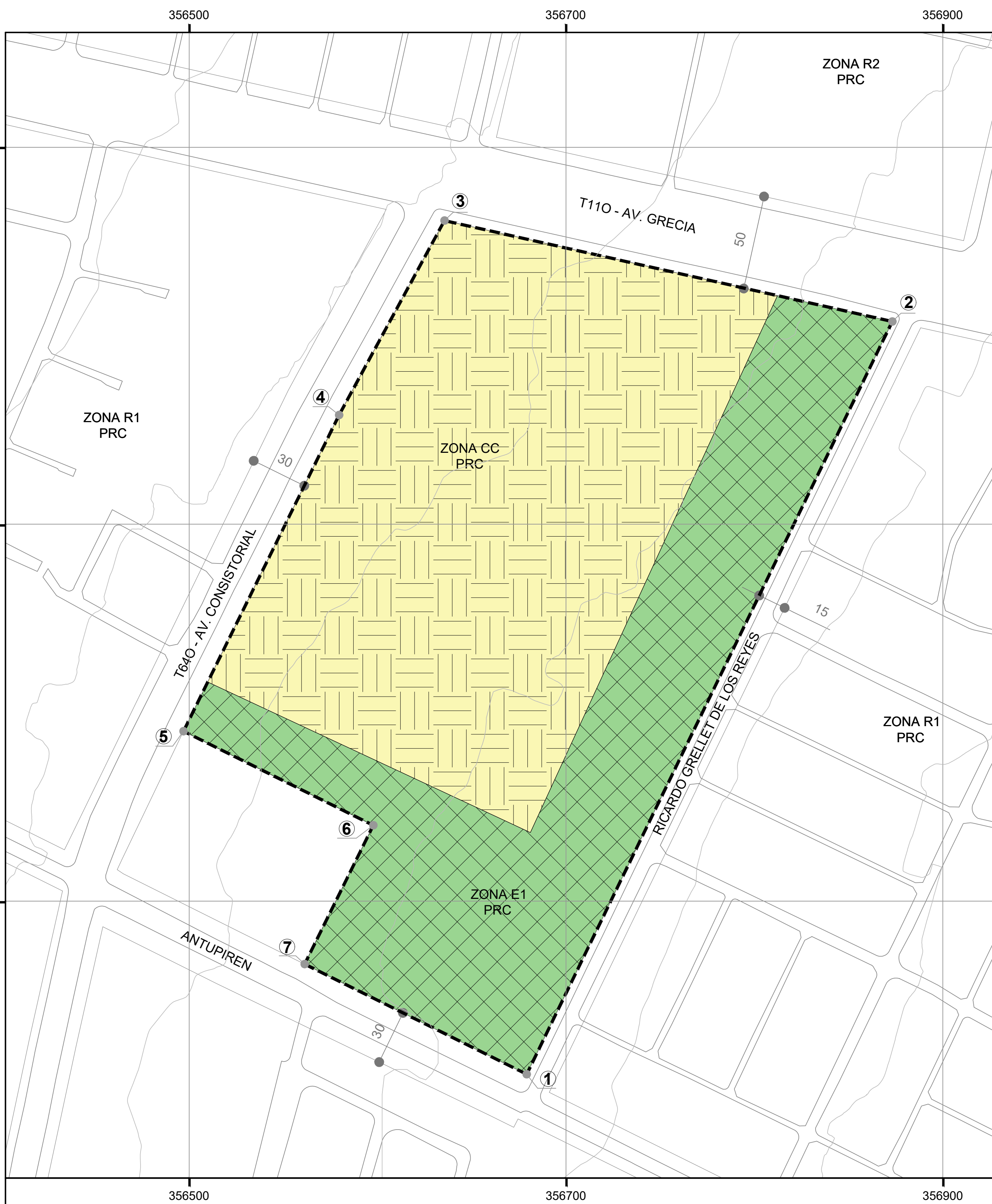
SITUACION ANTERIOR ESCALA : 1:1.500

ABOGADO(A) MINISTRO DE FE MINISTERIO DE VIVIENDA Y URBANISMO